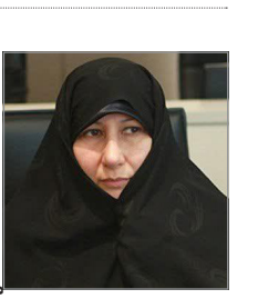
زهر(اسلام الله علیها) شدند.