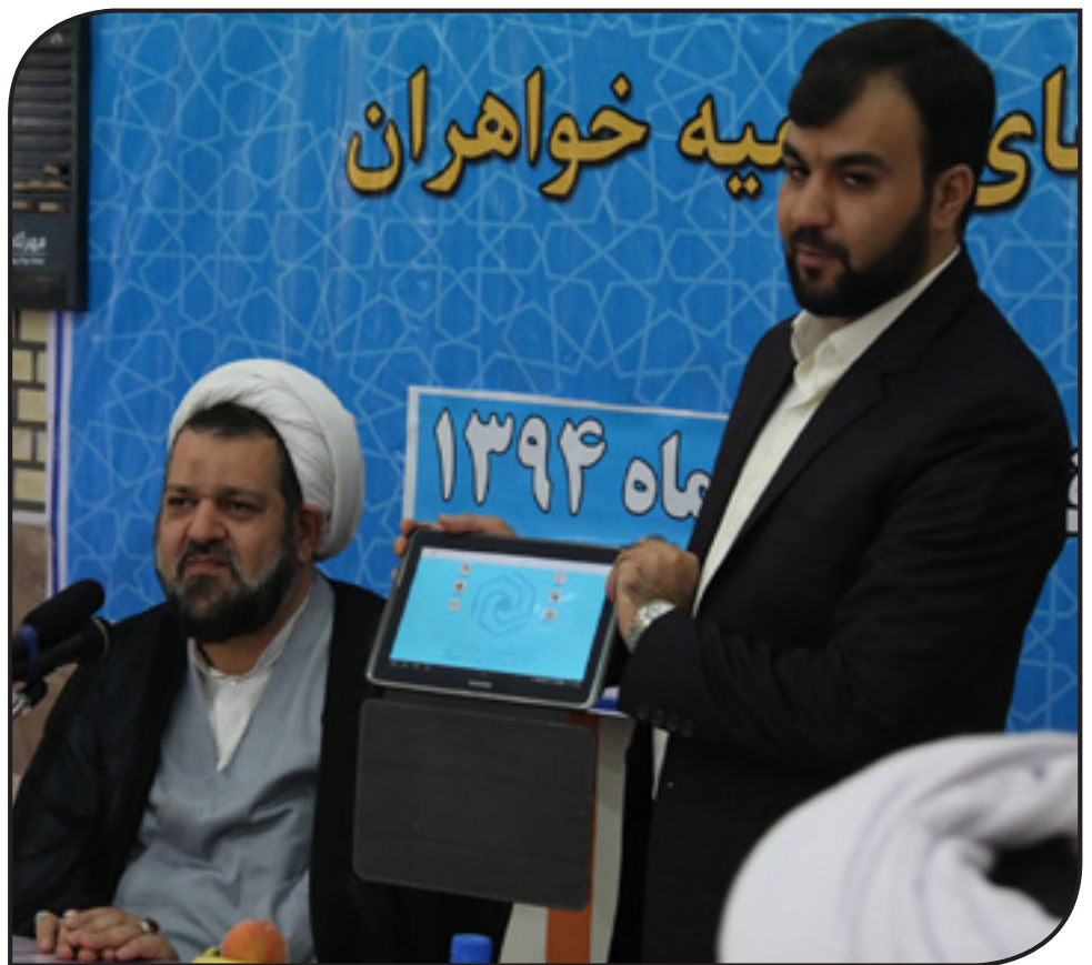
حطی مراسم ۶ سامانه جدید مبتنی بر موبایل حوزه‌های علمیه خاوران کشور رونمایی شد.

کارشناس امور کتابخانه‌های حوزه‌های علمیه خاوران: