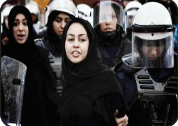
گروه بین‌الملل: آمارها نشان می‌دهد که مسلمانان در فرانسه نسبت به پیروان سایر ادیان بیشتر مورد تبعیض قرار می‌گیرند. به گزارش روزنامه «حریت» ترکیه، کمیسیون ملی مشاور حقوق بشر فرانسه در اولین گزارش سالانه خود از افزایش تبعیض دینی و نژادی در این کشور خبر داد.

گروه بین‌الملل: یک سازمان بحرینی - آلمانی حقوق بشر با اشاره به این که ۱۳ زندانی زن سیاسی دربند زندان‌های دولت بحرین هستند، آزادی سریع تمامی زنان بازداشت‌شده در این کشور را خواستار شد. به گزارش پایگاه خبری شبکه جهانی اللؤلؤة؛ سازمان بحرینی - آلمانی حقوق بشر(BGO) با صدور بیانیه‌ای از مقامات کشور بحرین خواست به حقوق زنان احترام گذاشته و همه زندانیان زن در این کشور را سریعاً آزاد کنند. این نهاد حقوق بشری در ادامه شجاعت و پایداری زنان بحرینی در مطالبه حقوق سیاسی، اجتماعی و مدنی خود را ستود و اعلام کرد که ۱۳ زن به انگیزه‌های سیاسی دربند زندان‌های دولت بحرین هستند.