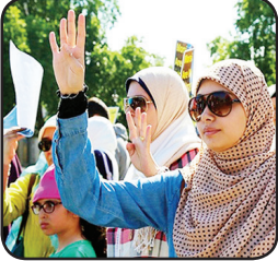
گروه بین‌الملل: آمارها نشان می‌دهد که مسلمانان در فرانسه نسبت به پیروان سایر ادیان بیشتر مورد تبعیض قرار می‌گیرند. به گزارش روزنامه «حریت» ترکیه، کمیسیون ملی مشاور حقوق بشر فرانسه در اولین گزارش سالانه خود از افزایش تبعیض دینی و نژادی در این کشور خبر داد.

ورود بانوان به اتحادیه قاریان مصر گروه بین‌الملل: رئیس اتحادیه قاریان مصر از رایایی شماری از بانوان قاری قرآن به این اتحادیه خبرداد. به گزارش پایگاه خبری الوطن: «شیخ محمد محمود طبلادی»، در گفت‌وگو با شبکه ماهواره‌ای «النهار» با اعلام این خبر گفت: من خودم قرات و اجرای یکی از این بانوان قاری را مورد ارزیابی قرار دادم و کمیته‌ای نیز به منظور ارزیابی وی تشکیل دادم. وی افزود: این بانوی قاری، آیاتی از قرآن را برای من تلاوت کرد و اجازه‌نامه تلاوت را نیز از من دریافت کرد. طبلادی در ارتباط با امکان تلاوت بانوان در محافل سوگواری و دیگر مراسم‌ها گفت: این پدیده جدیدی نیست و در گذشته نیز دو تن از زنان قاری در رادیو مصر قرآن تلاوت می‌کردند.