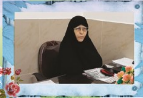
مدرسه علمیه فاطمه الزهرا (س)