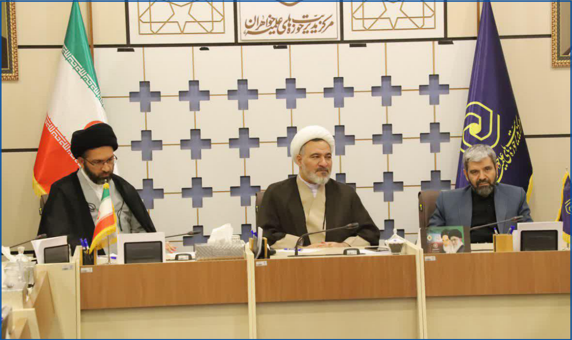
مدیر حوزه علمیه خواهران استان اصفهان:

به یقین این روزهای سخت، سپری خواهد شد؛ اما ایثار و فداکاری شما مدافعان سلامت، برای همیشه ماندگار خواهد ماند و در نزد خداوند حکیم مأجور خواهید بود.