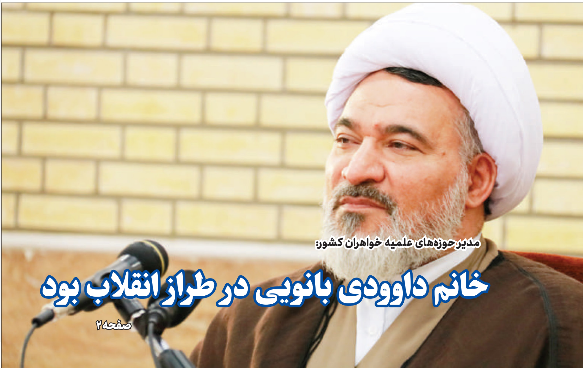
مدیر حوزه‌های علمیه خواران کشور: