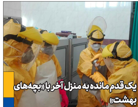
یک قدم مانده به منزل آخر با «پچه‌های بهشت»