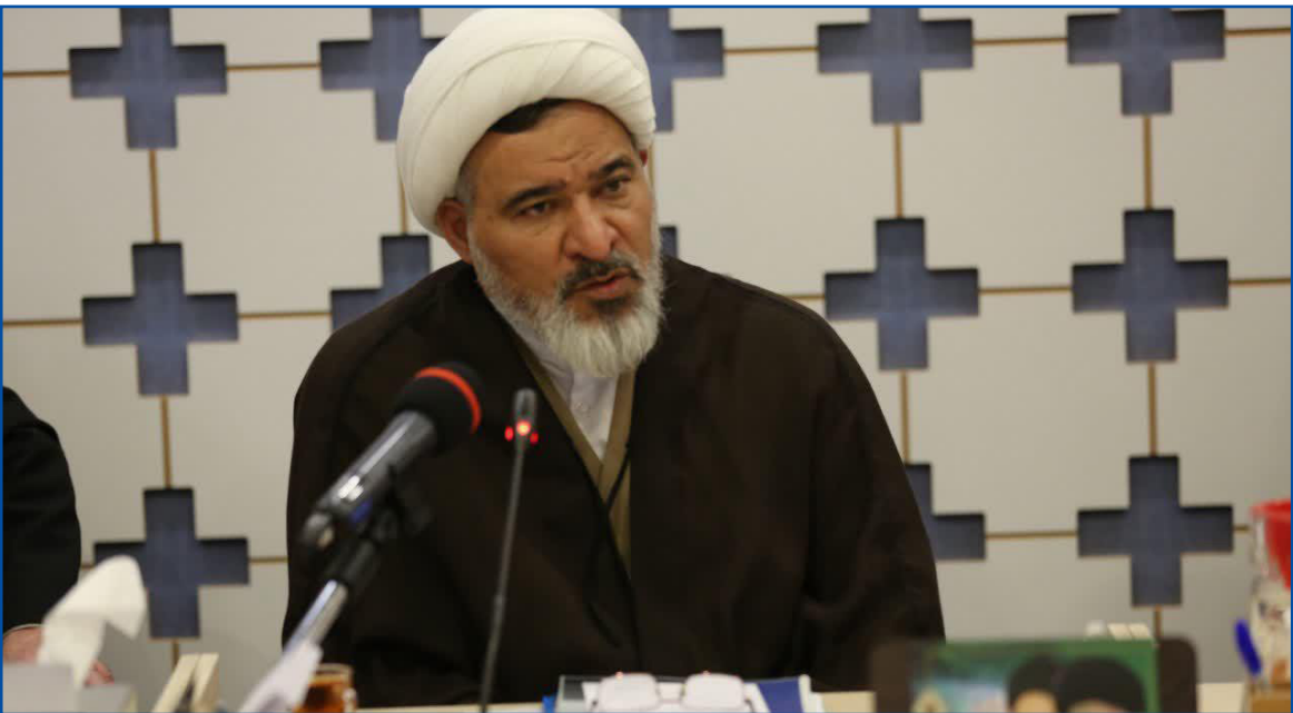
مدیر حوزه های علمیه خواهران: