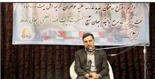
از ایجاد ساختمان جدید مدرسه علمیه کریمه اهل‌بیت (علیه‌السلام)

گفت: ایجاد یک مرکز حوزوی برای خواهران در منطقه محروم می‌تواند آثار مطلوبی را برای این منطقه به دنبال داشته باشد.