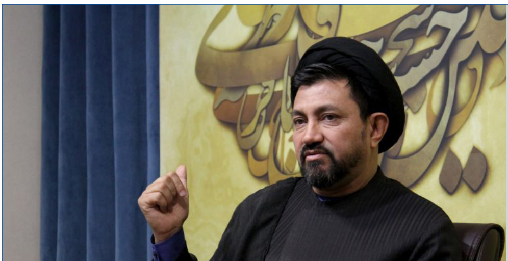
مدیر مرکز اسلامی آفریقای جنوبی:

وی در پایان شرکت در دوره بین المللی آنلایین فلسفه اسلامی را یکی از راه‌های تقویت در عرصه تبلیغ بین الملل دانست و گفت: هر شخصی با گذراندن تخصصی یک دوره اصول فلسفه اسلامی تبدیل به یک مبلغ توانا می‌شود، زیرا ما تمامی سوالاتی که مبلغان با تجربه با آن مواجه شده‌اند را گردآوری و پاسخ آن را به صورت عقلی و علمی آماده کرده ایم و دانستن این مسائل به آمادگی مبلغان برای پاسخگویی به سوالات مختلف در شرایط متفاوت کمک شایانی می‌کند.