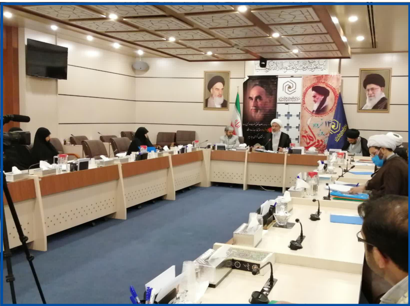
مداوم انجام دهند.