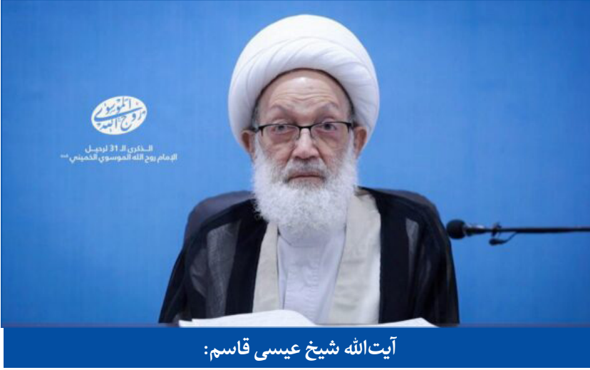
آیت‌الله شیخ عیسی قاسم:

برای هر انسانی، شرایطی که امتداد افق و بزرگی‌اش در زندگی و قدرت، هدایت، صداقت ارزش‌ها، جوهر حرکت، محور جهاد، فراخی نگاه و دایره توجهش در آن