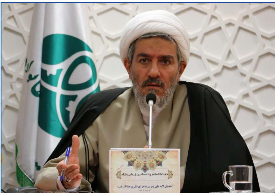
رئیس مرکز تحقیقات زن و خانواده: