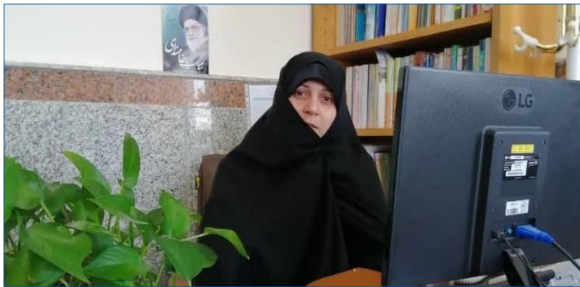
با همکاری کمیته امداد و حوزه های علمیه خواهران انجام شد:

های مردمی کمیته امداد امام خمینی(ره) برگزار شد، پیرامون انتظارات و مسائل پیش رو و روند فعالیت مراکز نیکوکاری در حوزه های علمیه خواهران بحث و تبادل نظر شد. رئیس اداره امور زنان و خانواده مرکز مدیریت حوزه های علمیه خواهران در ادامه افزود: حجت الاسلام و المسلمین نامخواه در این نشست ضمن تشکر از خدمات و همکاری های صورت گرفته کمیته امداد امام خمینی(ره) در راستای راه اندازی ۱۲۸ مرکز نیکوکاری در کل کشور، کنشگری اجتماعی را از مهم ترین مسائل حوزه مددکاری اجتماعی در سطح حوزه های علمیه وی تصریح کرد: مدیر کل