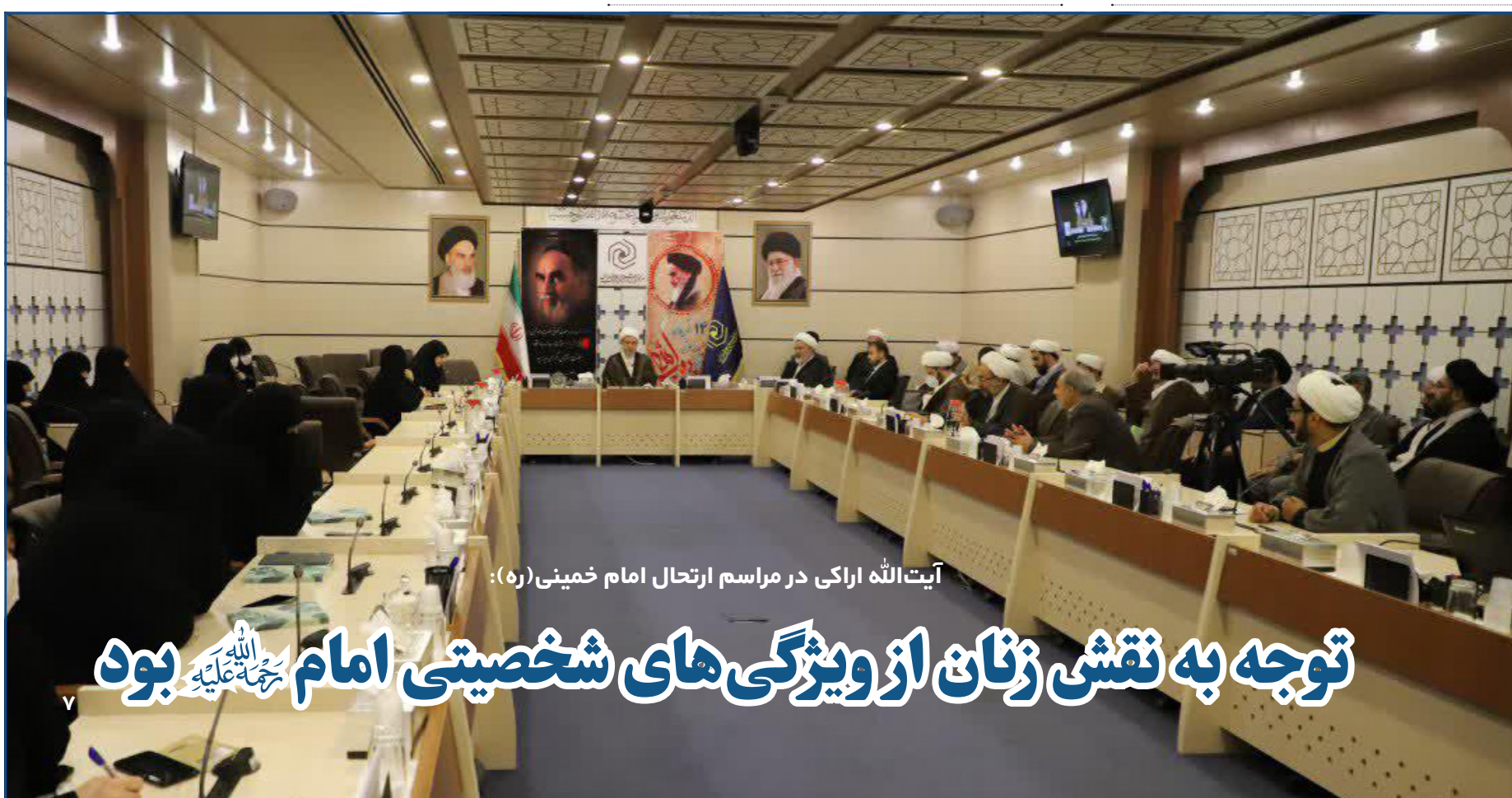
آیت الله اراکی در مراسم ارتحال امام خمینی (ره):