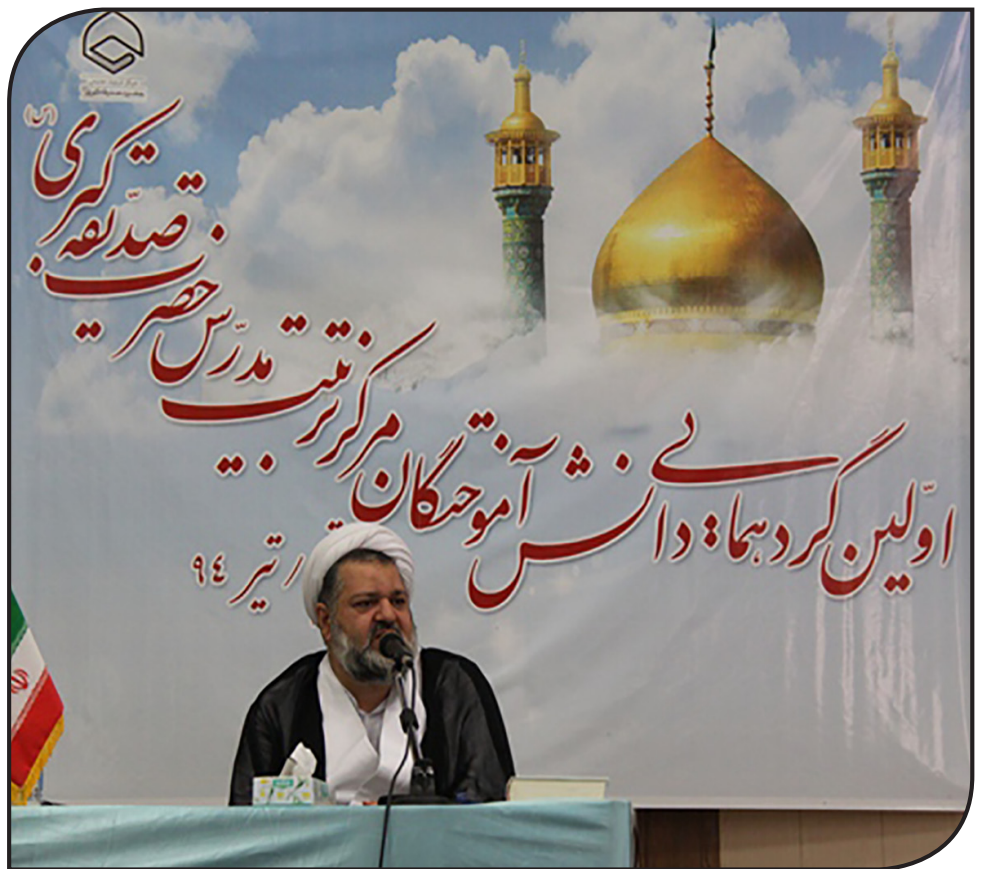
مدیر حوزه‌های علمیه خاوران کشور گفت: ارتقای علمی و مهارتی اساتید حوزه‌ها مورد توجه این نهاد است.

رئیس‌پیشین مرکز آموزش‌های غیر حضوری حوزه‌های علمیه خاوران: ۴ هزار طلبه خواهر در شیوه غیر حضوری حوزه‌های علمیه خاوران در حال تحصیل هستند