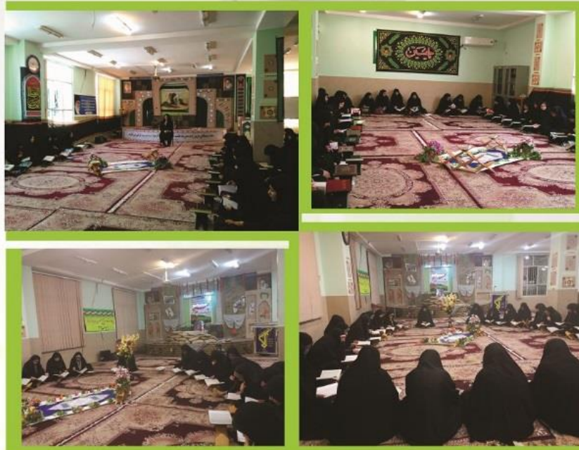
برگزاری جلسات زلال احکام در مدرسه علمیه فاطمه الزهرا (س) داراب و پایگاه صدیقه کبری (س)