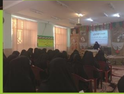
برگزاری نشست وحدت حوزه و دانشگاه و برگزاری حلقه صالحین با موضوع مهم ترین چالش و بهترین راهکار وحدت حوزه و دانشگاه