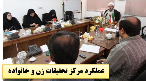
عملکرد مرکز تحقیقات زن و خانواده