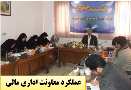
عملکرد معاونت اداری مالی