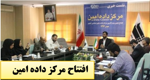
افتتاح مرکز داده آمین