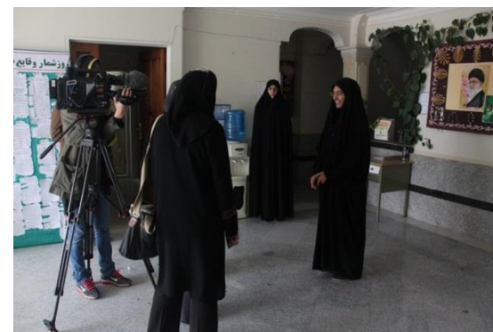
گزارش خبرنگار خارجی از مرکز تربیت مدرس