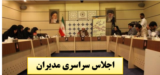
اجلاس سراسری مدیران