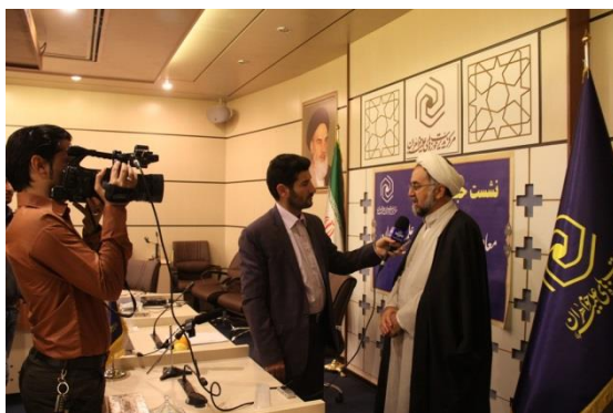
گزارش از برنامه‌های هفته پژوهش