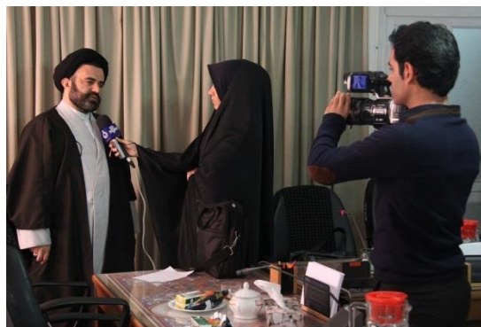
گزارش از آغاز پذیرش سراسری