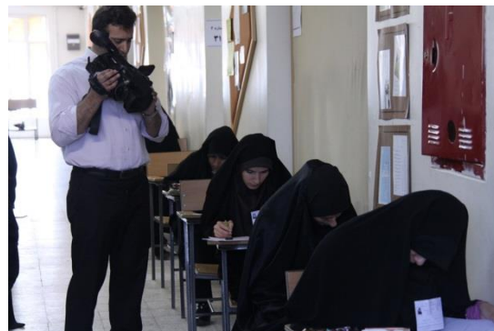
گزارش از آزمون سراسری