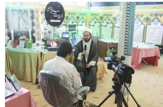
گزارش از غرفه مرکز در نمایشگاه قرآن