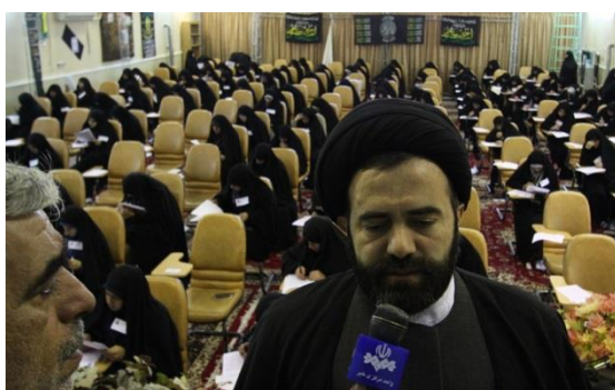
گزارش از برگزاری المپیاد علمی