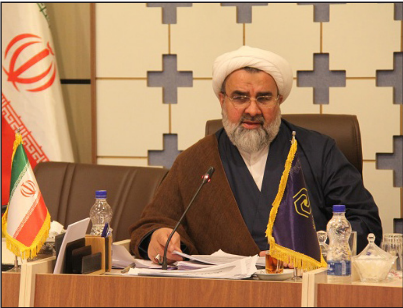
در بیانیه مشترک مراکز حوزوی عنوان شد

داد: با توجه به ضرورت اجتماعی و اهمیت عفاف و حجاب و نیز جایگاه حوزه‌های علمیه خواهران به عنوان نهاد تصمیم ساز و تأثیرگذار در فرهنگ سازی مقوله‌های مهم اجتماعی، شعار «حجاب، عامل تحکیم خانواده و کاهش آسیب های اجتماعی» به عنوان شعار محوری برای فعالیت‌های فرهنگی و تبلیغی در این موضوع انتخاب گردیده است. وی با اشاره به ظرفیت‌های عظیم حوزه‌های علمیه خواهران اظهار داشت: توجه و اهتمام ویژه به بهره‌برداری و استفاده از ظرفت طلاب، مبلغات و دانش‌آموختگان مستعد، می تواند در پیشبرد و جریان‌سازی فرهنگ عفاف و حجاب موثر باشد، از این رو ضروری است از تمام ظرفیت‌ها برای نهادینه کردن فرهنگ عفاف و حجاب استفاده نمود. وی با بیان این که این طرح از تاریخ ۱۹ تیر آغازو تا ۲۵ تیر ادامه دارد تصریح کرد: مهلت ثبت گزارش‌های مربوط به طرح عفاف و حجاب از تاریخ ۲۶ تیر ماه الی ۳ مرداد ماه ۹۶ می‌باشد و همچنین ارزیابی آثار شرکت کنندگان از تاریخ ۲۶ تیر ماه الی ۵ مرداد ماه ۹۶ انجام خواهد شد. حجت‌الاسلام والمسلمین اسکندری در پایان گفت: اسامی برگزیدگان، همزمان با ولادت حضرت امام علی بن موسی الرضا (ع) در تاریخ ۱۳ مرداد ۹۶، از طریق پایگاه اطلاع‌رسانی معاونت فرهنگی تبلیغی farhangi.whc.ir منتشر خواهد شد.