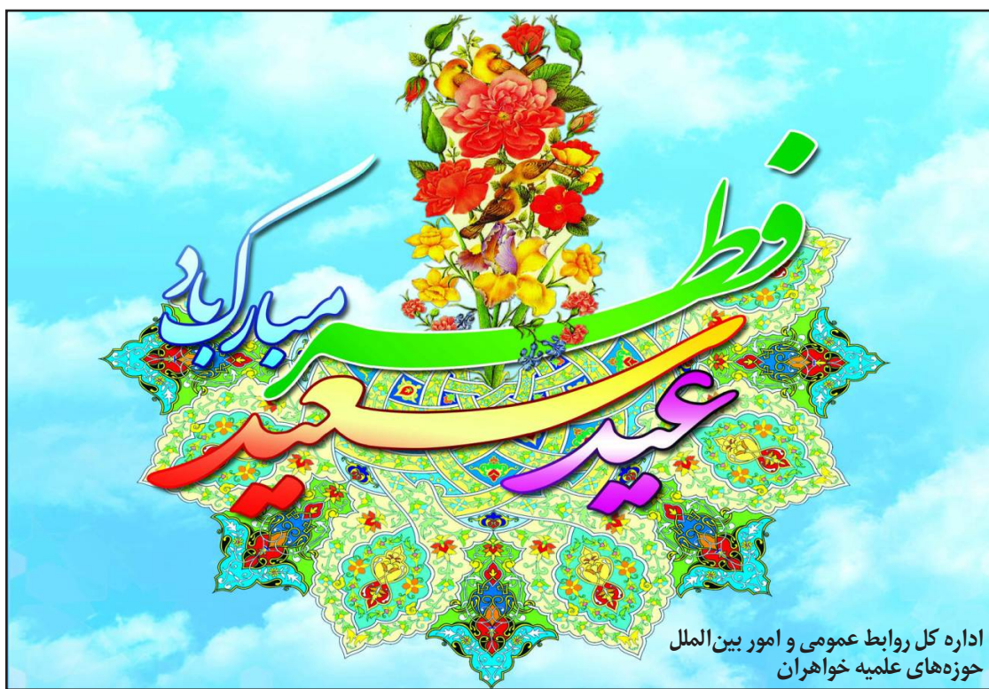
اداره کل روابط عمومی و امور بین‌الملل حوزه‌های علمیه خاوران

خواهران طلبه خدمات حوزه‌های علمیه را در معرض افکار عمومی قرار دهند