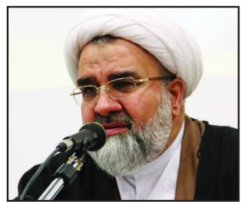
حجت‌الاسلام اسکندری با تأکید بر این‌که مسأله قدس ارتباط تنگاتنگی با جهان اسلام و بشریت دارد، گفت: اگر جهان

اسلام دارای آرامش باشد، به پیشرفت می‌رسد و برای رسیدن امت اسلامی به این آرامش باید غده سرطانی یعنی اسرائیل غاصب را خشکانند. معاون فرهنگی حوزه‌های علمیه خاوران کشور، رژیم صهیونیستی را مانع گسترش اسلام دانست و یادآور شد: اگر این غده کهنه شود، فضای جامعه اسلامی آرام شده و معارف آن را می‌توان به جهانیان معرفی کرد. وی در پایان خواستار تبیین این مسائل از سوی خواهران و برادران طلبه برای مردم شد.