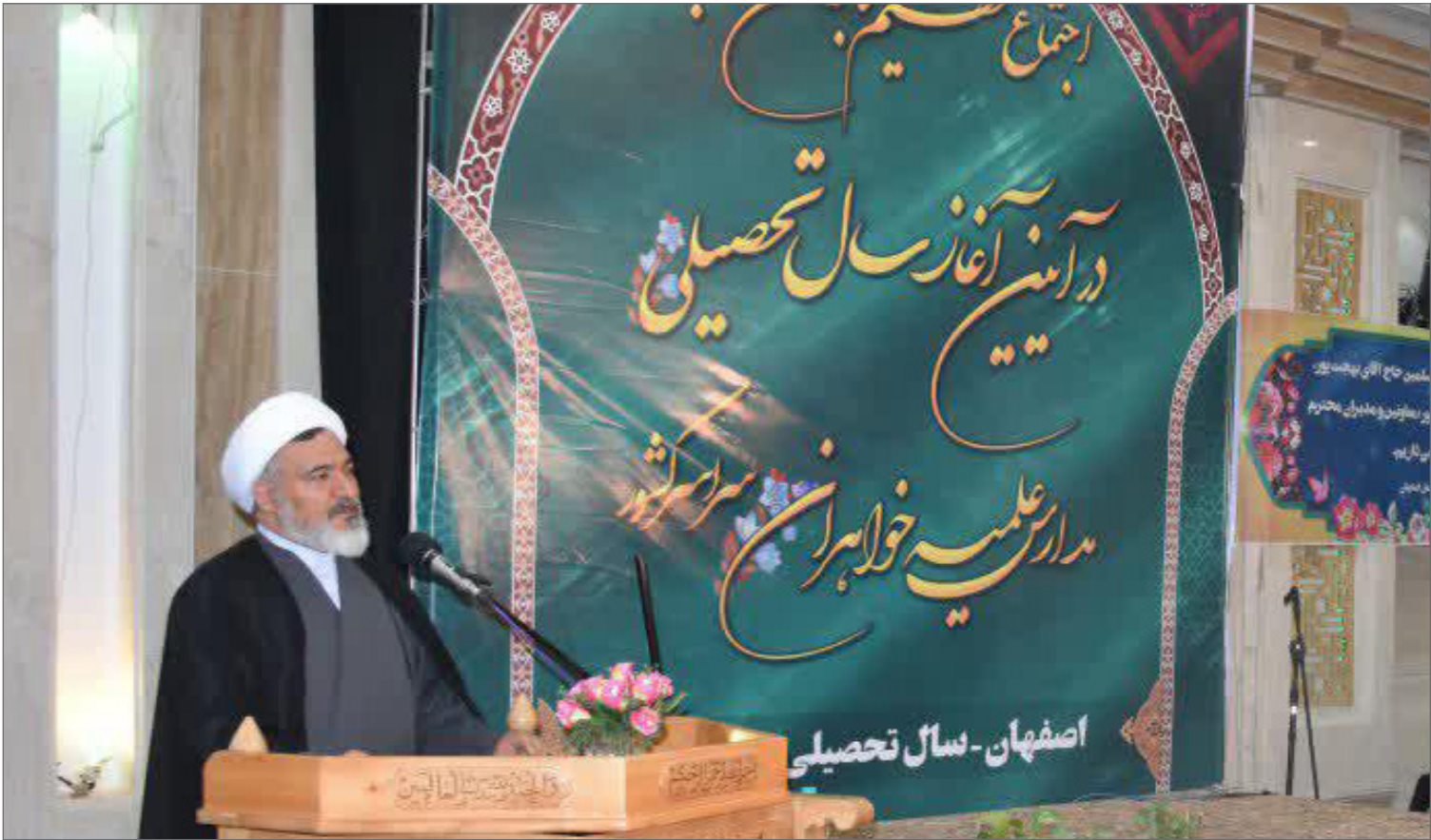
مدیر حوزه‌های علمیه خواهران:

قدر مجالس عزاداری را بدانند، از این مجالس استفاده کنند و روحاً و قلباً این مجالس را وسیله‌ای برای ایجاد ارتباط و اتصالِ هرچه محکم‌تر میان خودشان و حسین بن علی علیه‌السلام، خاندان پیغمبر و روح اسلام و قرآن قرار دهند. ۱۷/۰۳/۱۳۷۳