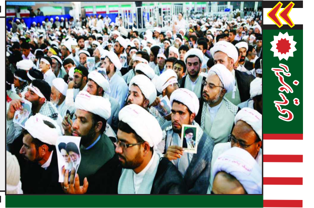
توسعه و پیشرفت