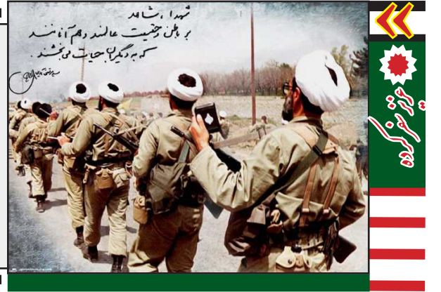
مدیر حوزه‌های علمیه خواهران در اجلاس مدیران مطرح کرد: