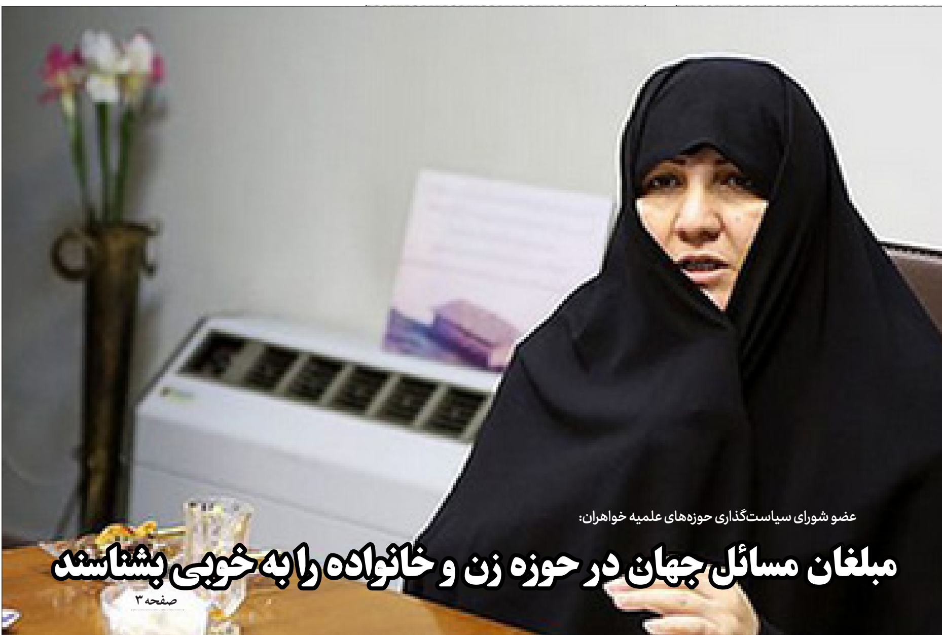
عضو شورای سیاست گذاری حوزه های علمیه خواهران: