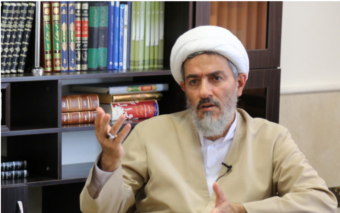
رئیس پژوهشکده زن و خانواده:

حجت الاسلام والمسلمین زیبایی نژاد ادامه داد: در جریان فمینیسم هم بعضی ها اعتقاد دارند که این فضا می تواند کمک کننده باشند و بعضی ها تردید دارند، انقلاب هایی بهار عربی با همین هیچکس ها صورت گرفته است اما تا زمانی که می خواهید تخریب کنید و انقلاب کنید این جنبش های بدون سرو بدون نشان می