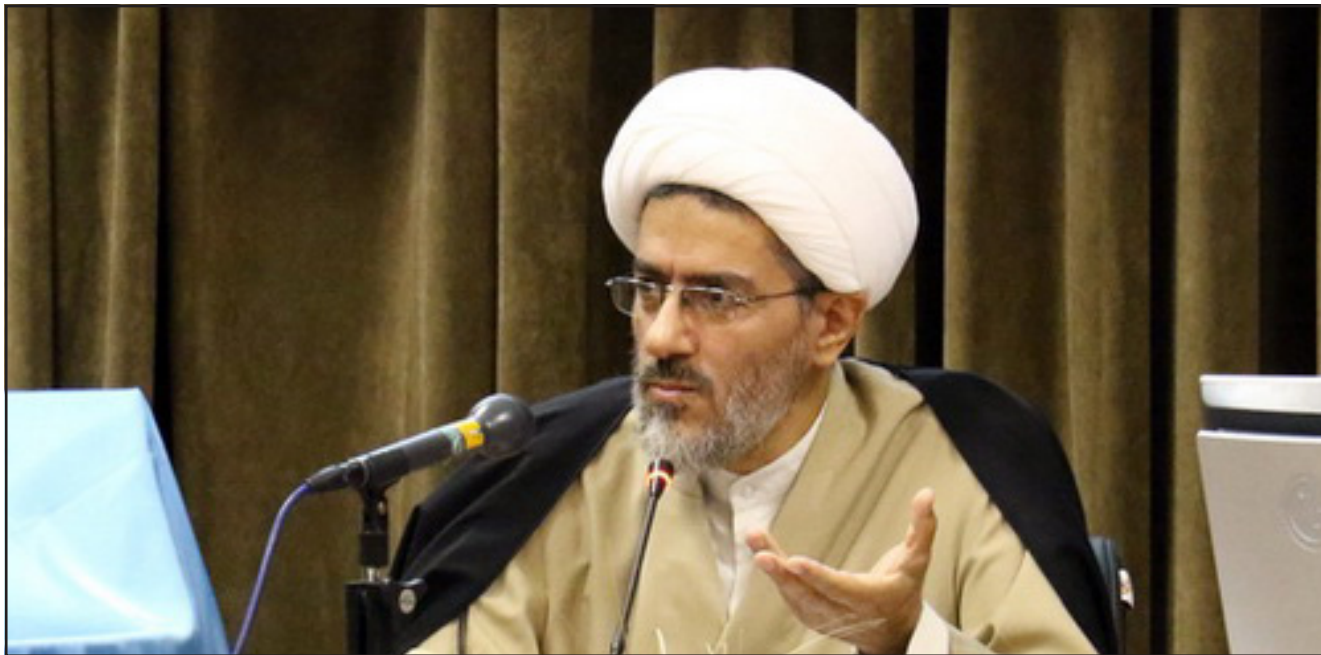
رئیس مرکز تحقیقات زن و خانواده:

رئیس مرکز تحقیقات زن و خانواده تصریح کرد: در دهه ۱۳۷۰ در دولت مرحوم آیت الله هاشمی رفسنجانی بخش دفتر حقوق زنان در ریاست جمهوری راه اندازی شد و این دفتر سمن هایی را برای زنان ایجاد کرد که گرا و افراد چپ راه انداختند و در دهه ۴۰ و اوایل دهه ۵۰ موج دوم جریان فمینیستی در اروپا و آمریکا شکل گرفت و این زنان کنفدراسیون پیشنهاد دادند که موضوع زنان در کشور را در اولویت قرار دهیم و در سال ۵۵ اولین ویژه نامه خود