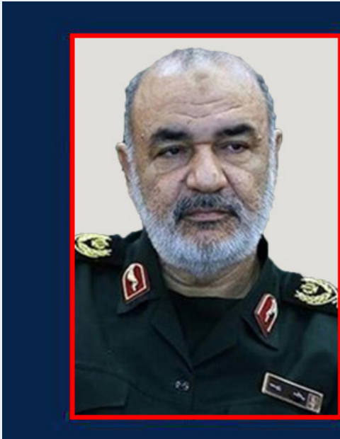
مدیر حوزه های علمیه خواهران کشور با صدور پیامی به سردار سلامی پرتاب موفقیت آمیز ماهواره قضایی نور توسط تبریک گفت.

سرلشکر پاسدار حسین سلامی فرمانده کل سپاه پاسداران انقلاب اسلامی