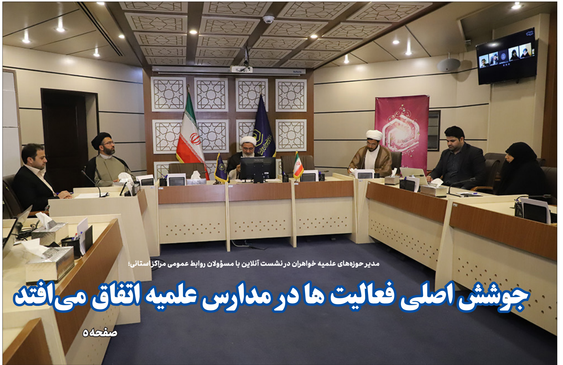
مدیر حوزه های علمی خاوران در نشست آنلاین با مسئولان روابط عمومی مراکز استانی؛