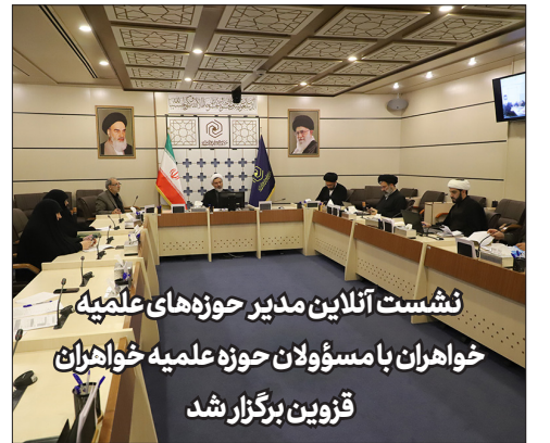
نشست آنلاین مدیر حوزه های علمی خاوران با مسئولان حوزه علمی خاوران قزوین برگزار شد

بانوان ثابت کردند علاوه بر اجرای نقش همسری و مادری در خانواده، با حضور در جامعه تأثیر بسزایی در رشد علمی و معرفی جامعه دارند