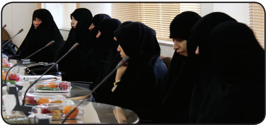
مدیر مدرسه علمیه خواهران فاطمه‌الزهرّا(ع)

مدیر مدرسه علمیه خواهران فاطمه‌الزهرّا(ع) مردودشت در نشست هم‌اندیشی که با حضور معاونان و کارکنان این مدرسه برگزار شد، گفت: مشورت و تبادل نظر بین واحدهای مختلف در مدرسه باعث ارتقای سطح کیفی امور مختلف اعم از آموزشی، پژوهشی، فرهنگی ... خواهد شد.