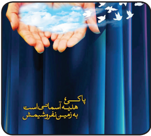
پاکبُتْ آبِست‌ایست به ژمیس‌نفروشمیش