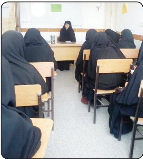
پای تجربه استاد

این فراخوان که با همکاری معاونت آموزش و شبکه کوئرت برگزار شده روایتی است از خاطرات شیرین و تأثیرگذار استادان گرانقدر از لحظات ناب تدریس و ارتباط با طلاب. استادان با شرکت در این فراخوان، بیاد ماندنی ترین تجربیات و خاطرات تدریستان را با هشتک #پای_تجربه_استاد به اشتراک گذاشته اند تا دفتری شود از لحظه های ناب و شیرین تدریس.