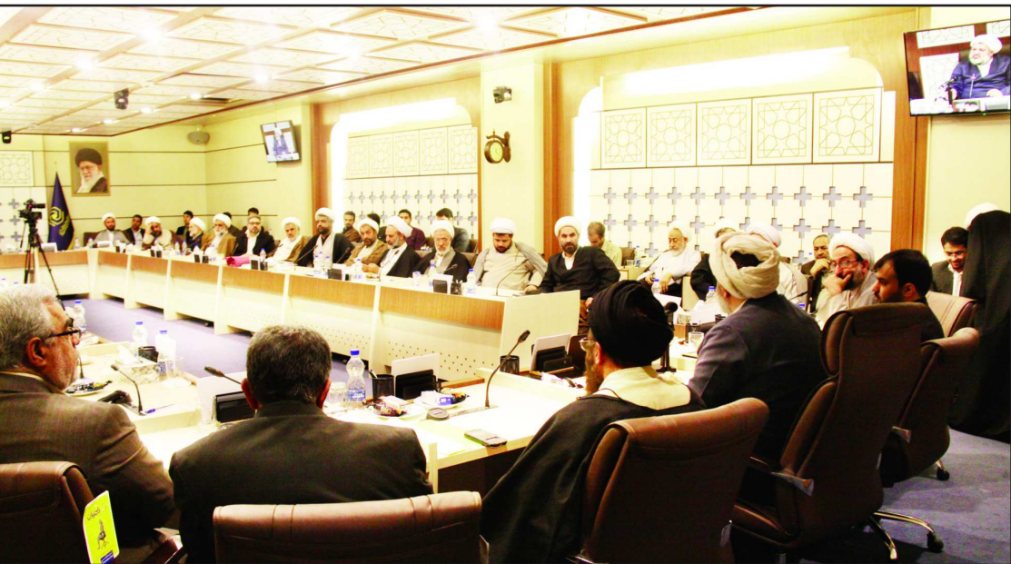
در نشست مدیران استانی حوزه های علمیه خواهران با معاونت اداری- مالی تصریح شد