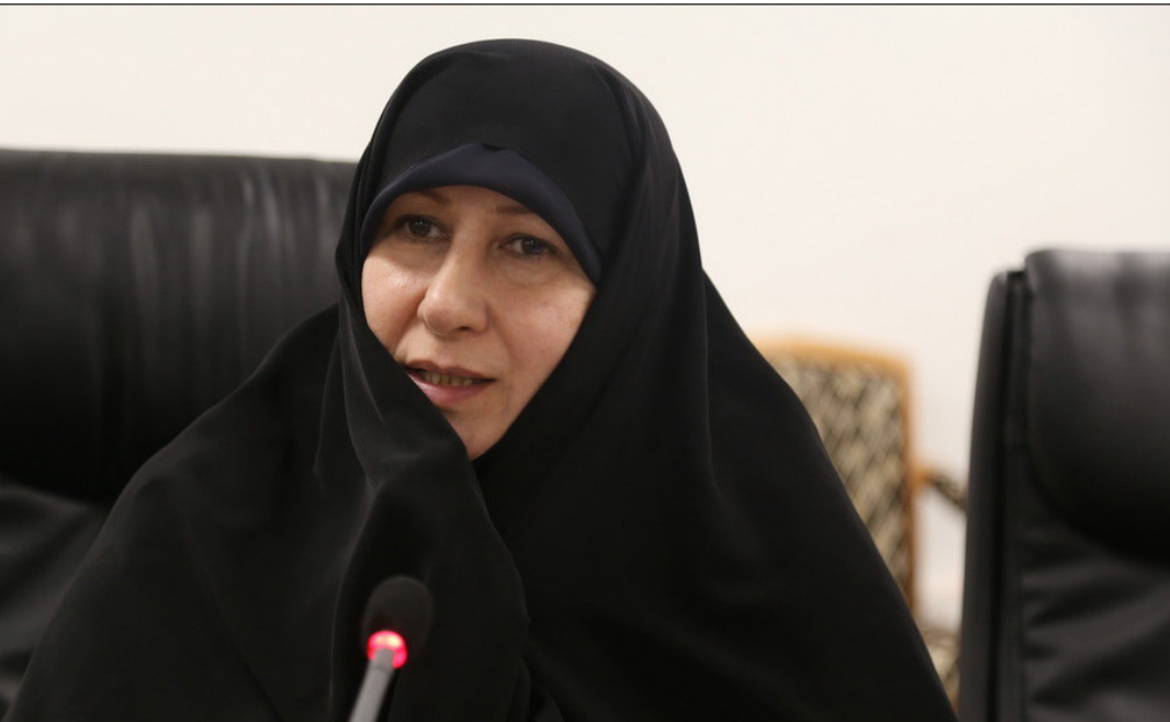
معاون فرهنگی تبلیغی حوزه‌های علمیه خواران کشور:

این استاد حوزه و دانشگاه در پایان تأکید کرد: در حال حاضر مشکل ما این است که نسل آینده ما وارث سرزمینی خواهند بود که روبه پیری، کم‌نشاطی و کمبود نیروی مولد جوان می‌رود. لذا برای اینکه بتوانیم امنیت آینده سرزمین خود را تأمین کنیم، بایستی در دهه‌های پیش رو اقدامات هوشمندانه‌ای را به منظور افزایش جمعیت انجام شود.