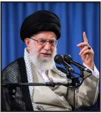
آیت الله العظمی مکارم شیرازی

حادثه‌ی غدیربه نگاه مرحوم علامه‌ی امینی (رضوان الله تعالی علیه) صاحب کتاب الغدیرو بعد در نگاه مرحوم شهید مطهری (رضوان الله علیه) وسیله‌ی وحدت امت اسلامی است. گمان نکنند بعضی که حادثه‌ی غدیر مایه‌ی اختلاف است. نه. امروز ببینید که بیش از همیشه – درگذشته هم بوده است – شیعه را متهم میکنند. ببینند مسئله‌ی تشیع برآمده‌ی از یک اعتقاد صحیح سالم خالص نسبت به وحی الهی است – این است معنای تشیع – اعتقاد به ارزشهاست، اعتقاد به معیارهاست، ملاک قرار دادن معیارهایی است که قرآن آنها را ملاک قرار داده است. بیانات در دیدار مردم به مناسبت عید غدیر۱۳۸۹/۹/۱۵