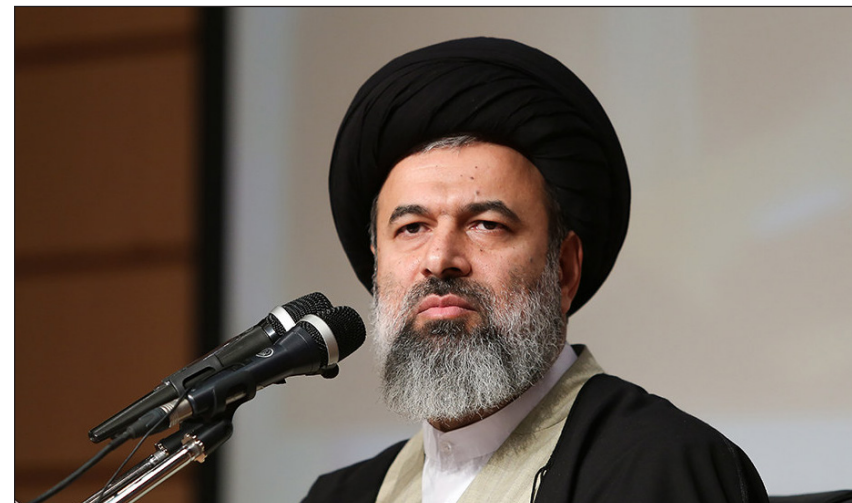
معاون ارتباطات و امور حوزه های علمیه خاوران کشور:

وی اضافه کرد: حوزه های علمیه به ویژه حوزه های خاوران برای توسعه تمدن فاطمی، علوی و حسینی تلاش می‌کنند و به وظایف خود در راستای گسترش حوزه های علمیه و ارتقای توانمندی های حوزه های علمیه تلاش کنند.