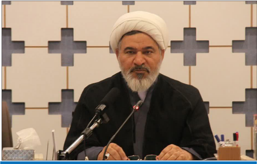
مدیر حوزه‌های علمیه خاوران:

وی با بیان اینکه در حال حاضر بالغ بر ۴۰۰ مدرسه علمیه خاوران سطح دو در سراسر کشور وجود دارد خاطر نشان کرد: داوطلبان برای کسب اطلاعات بیشتر و ثبت نام می‌توانند به مدارس علمیه خاوران سراسر کشور و یا پایگاه اینترنتی www.whc.ir مراجعه کنند.