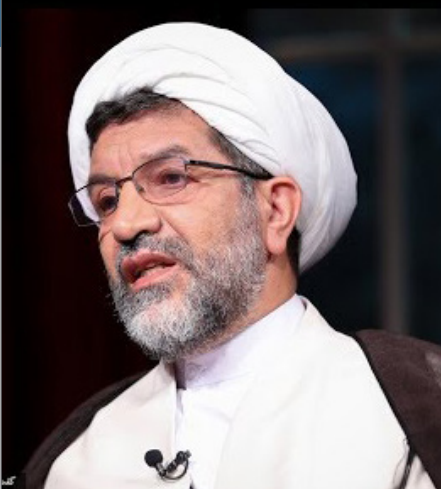
حجت الاسلام والمسلمین پارسا با اشاره به مسئله آموزش رشته‌های اجتماعی در حوزه‌های علمیه خاوران گفت: فرصت‌های ما به سرعت

در حال گذر هستند و باید برای دانش‌افزایی در حوزه علوم اجتماعی و سیاسی در خاوران اقدام کرد. حجت الاسلام والمسلمین پارسا در جلسه هیئت اندیشه‌ورز علوم اجتماعی حوزه‌های علمیه خاوران که ظهر امروز در سالن جلسات حوزه‌های علمیه خاوران برگزار شد با اشاره به مسئله آموزش رشته‌های اجتماعی در حوزه‌های علمیه خاوران اظهار کرد: فرصت‌های ما به سرعت در حال گذر هستند و باید برای