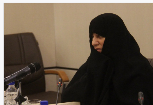
خانم داودی گفت: پذیرش حوزه‌های علمیه خاوران در سطح دو (کارشناسی) از ۲۳ تیرماه آغاز شد و تا ۵ شهریور ادامه دارد.

خانم داودی در گفت‌وگو با خبرنگار خبرگزاری کوثر با اشاره به مهلت پذیرش حوزه‌های علمیه خاوران کشور گفت: پذیرش حوزه‌های علمیه خاوران در سطح دو (کارشناسی) از ۲۳ تیرماه همزمان با ولادت باسعادت علی بن موسی الرضا علیهما السلام آغاز شد و تا ۵ شهریور ادامه دارد.