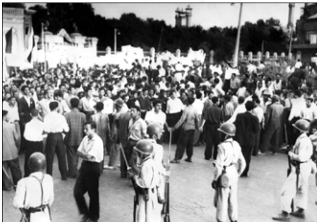
۱۵ خرداد ۱۳۴۲

... شاه و ملکه فرح به اتفاق دو فرزندشان چهارشنبه (۱۵ خرداد) که اوج شورش بود، تهران را به قصد کاخ سعدآباد ترک گفتند... وزارت دادگستری تعداد کشته شدگان را هفتاد و چهار نفر شمرده که شصت تن آن در تهران و چهارده تن در قم بوده است؛ اما به نظر می‌رسد که شمار قربانیان خیلی بیش از این باشد. حکومت به خبرهایی که در آن تعداد کشته شدگان یک هزار تن شمرده شده است، اعتراض کرد. بیمارستان‌های تهران به وسیله نظامیان محاصره شده است و به کسی اجازه ورود داده نمی‌شود. بیمارستان‌ها از دادن هرگونه اطلاعی درباره تعداد زخمی‌ها و کشته‌ها امتناع می‌ورزند.