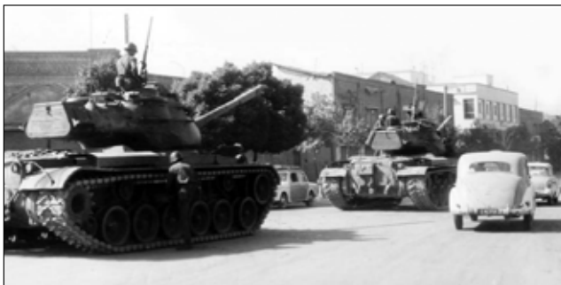
۱۵ خرداد ۱۳۴۲

این دلاوری مردم به پا خاسته در روز ۱۵ خرداد که نیروهای نظامی و انتظامی را سخت به وحشت افکنده بود، برگرفته از شجاعت حسینی