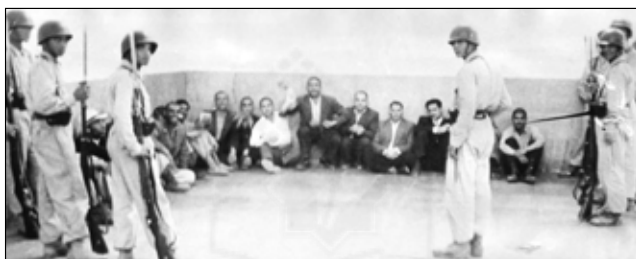
۱۵ خرداد ۱۳۴۲

شکاف بین رژیم سلطه و توده روز به روز عمیق‌تر می‌شود. ملاهای بزرگ در زندان به سر می‌برند و طرفداری توده با آنهاست. جبهه ملی و مخالفین چپ که خود را از حوادث کنار نگه داشته‌اند برنامه معین ندارند و به نظر می‌رسد بیشتر از گذشته ایزوله شده باشند. دانشجویان دست به یک حرکت انقلابی زده‌اند ولی مخالفت آنها تاکنون از محدوده دانشگاه تجاوز نمی‌کند. کارگران در تهران به شدت و گرمی استقامت می‌ورزند ولی سازمان مرتبی ندارند. ۱