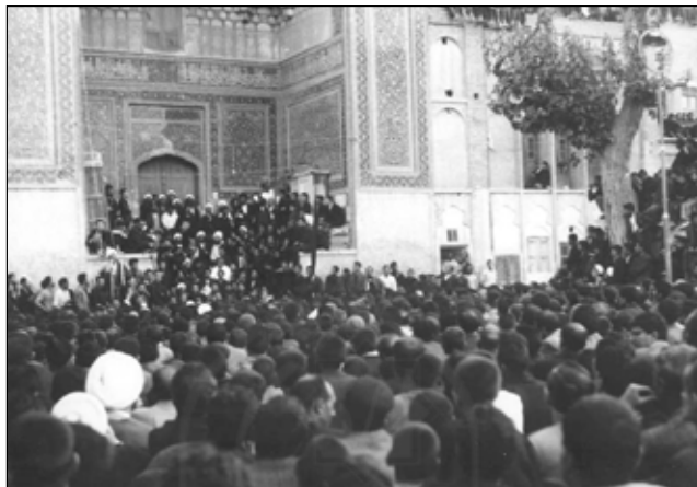
۱۵ خرداد ۱۳۴۲

نیروهای مسلح آنان را عقب راند. گروه دیگر برای دستیابی به اسلحه اداره تسلیحات ارتش در جنب توپخانه را مورد حمله قرار دادند... ۱ قیام آگاهانه ملتی رشد یافته و با بصیرت در روز ۱۵ خرداد در تداوم آن قیام و نهادینه شدن مبارزه مردمی و نهضت اسلامی ایران نقش به سزایی داشت. بی تردید قیامی که بر پایه آگاهی و بصیرت پدید آید، هیچگاه پایان نمی یابد و زوال نمی پذیرد.