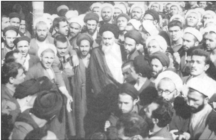
امام خمینی در جمع یاران خود در ابتدای نهضت، مقام معظم رهبری در پشت ایشان مشاهده می‌شود

خط موازی روی آوردند تا نهضت امام را به بیراهه بکشاند و اهداف اصلی آن را به دست فراموشی بسپارند، از این رو، ساواک مرکز، شماری از گویندگان اسلامی و روحانیان منبری را احضار کرد و از آنان خواست از سه موضوع سخن نگویند و دیگر هر چه بگویند و هر انتقاد و اعتراضی در سخنرانی‌هایشان مطرح کنند، ساواک به آنان کاری نخواهد داشت. علیه شاه سخن نگویند، علیه اسراییل نیز حرفی نزنند و دائم به گوش مردم نخوانند که اسلام در خطر است، دیگر هر چه بگویند آزادند!! این نقشه نیز از سوی امام برملا شد و امام در سخنرانی ۱۳ خرداد ۴۲ آن را فاش کرد.