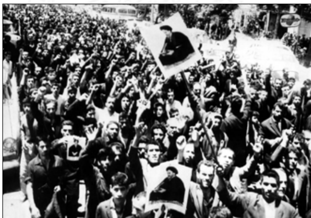
۱۵ خرداد ۱۳۴۲

کمک به زخمی شدگان را نداشتند ولی هنگامی که آتش خاموش شد و دود و آتش بر طرف گردید اجساد کشتگان ظاهر گشت و آنگاه با زاریان به سراغ یاران شهید خود آمده با روزنامه اجساد آنان را پوشاندند... به اطراف خود نگاه می کردم، قلب تهران به صبح بعد از توفان شبیه است. هر چیزی قطعه قطعه و ویران شده، تمام ادارات دولتی تعطیل و شهر مانند یک قلعه نظامی تسخیر شده است. فجیع ترین وضعی است که در دوران بیست ساله گذشته دیده ام. آتش و خرابی، بازار و ادارات دولتی و مغازه های فراوانی را فرا گرفته. دود سیاه به آسمان بلند است. غرش ماشین های آتش نشانی از هر گوشه ای به گوش می رسد ولی هنوز شعله آتش به آسمان زبانه می کشد... ۱