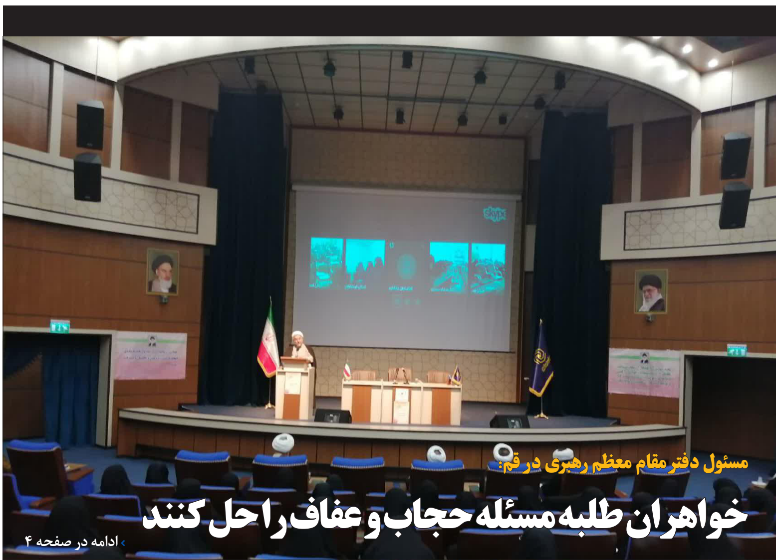
مسئول دفتر مقام معظم رهبری در قم: