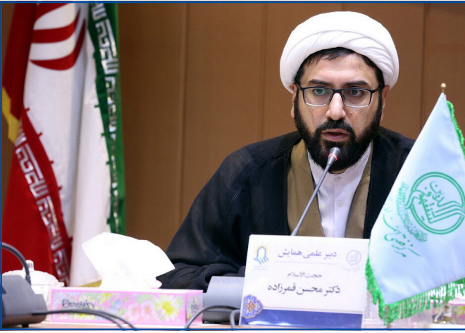
همایش حوزه‌های علمیه، مرجعیت شیعه و قرآن

دبیر علمی همایش حوزه‌های علمیه، مرجعیت شیعه و قرآن با بیان اینکه بیشترین مقالات به این همایش از حوزه علمیه خاوران با بیش از ۱۰۰ مقاله بوده است، افزود: یک چهارم مقالات قبل از اختتامیه چاپ شد.