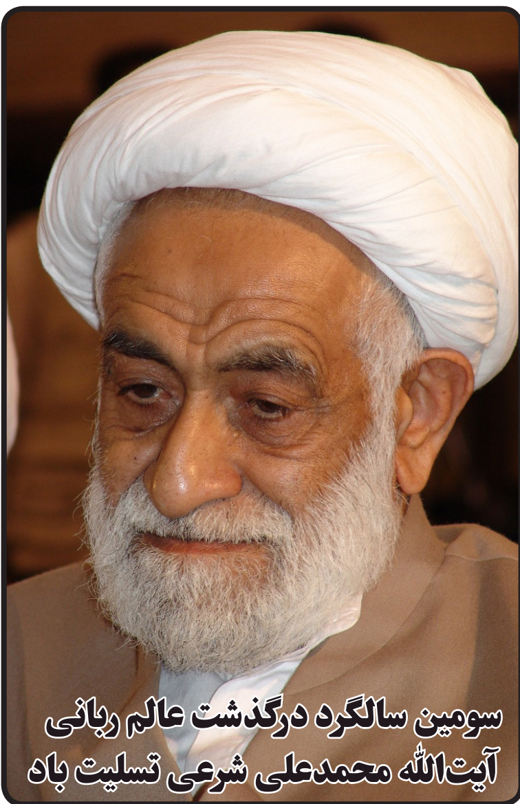
سومین سالگرد درگذشت عالم ربانی آیت الله محمدعلی شرعی تسلیت باد

وی افزود: ۹ دی از روزهای ارزشمند و ماندگار انقلاب اسلامی است که نشان دهنده بصیرت و حضور خودجوش مردم در مقابله با اقدامات آشوبگرانه دشمنان است.