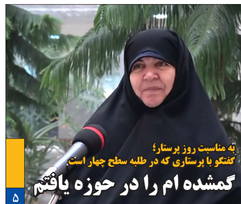
به مناسبت روز پرستار؛ گفتگو با پرستاری که در طلبه سطح چهار است گمشده ام را در حوزه یافتیم

این پرستار با بیان اینکه گمشده اش در حوزه پیدا شد، افزود: آرزویم این است که خداوند هیچ گاه طلبگی را از من نگیرد.