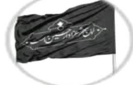
در زیارت عاشورا حرض می کنیم: «فَلْتَسَلِّمْ عَلَی الَّذِی أُخْبِرْتِی بِمُتَرَفِّقِکَ وَ تَسْرُقَ اَوْلَادِکَ وَ زَوْجِی»

بحارالانوار، مجلسی، ج ۶۵، ص ۲۲۶، باب ۲، أعمال خصوص بوم حرفة و لیلهای...، ص: ۲۱۲