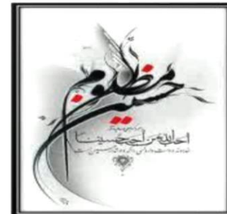
و اما سرگذشتی که در سینه‌های ما حک شده است...