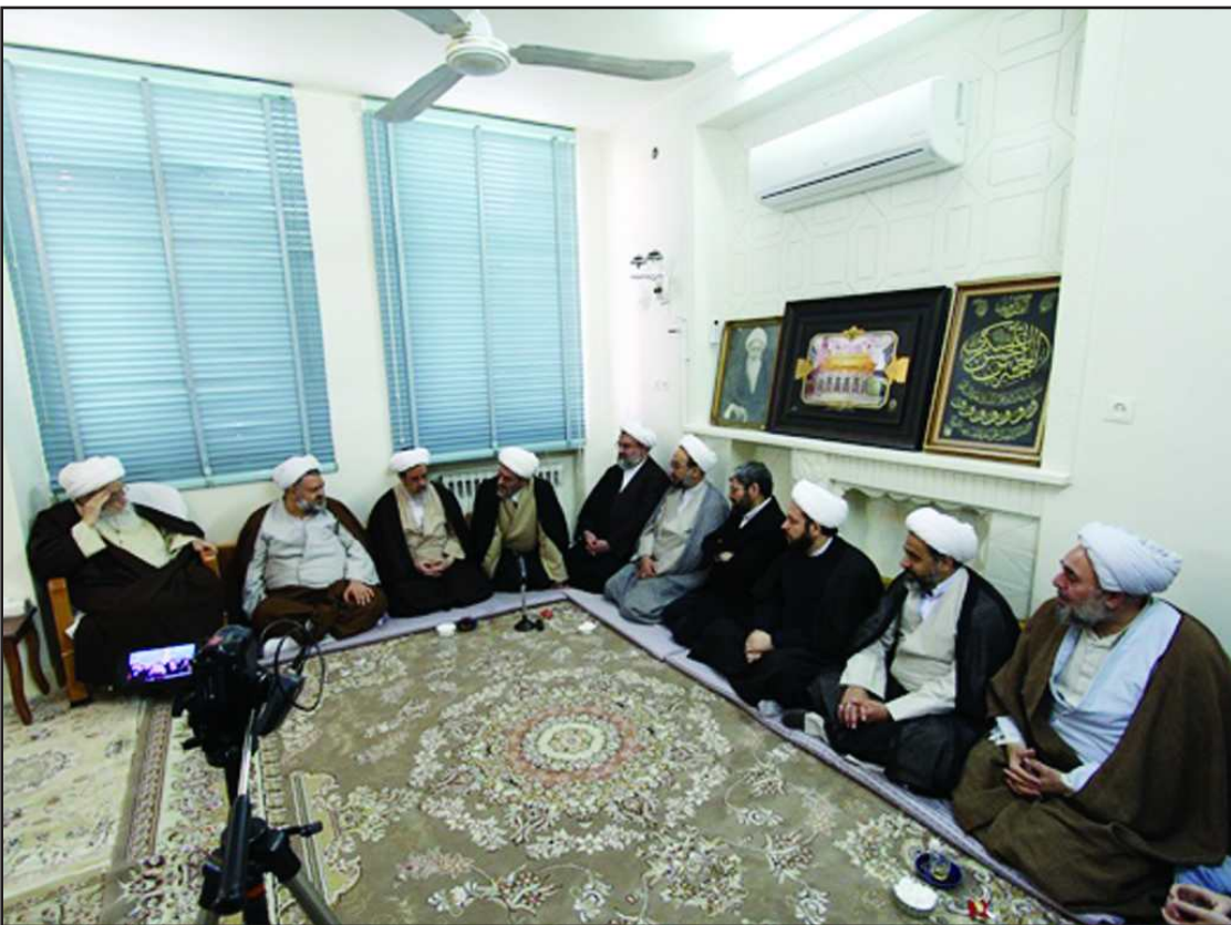
وزیر ارتباطات و فناوری اطلاعات در بازدید از مرکز داده امین خواستار شد