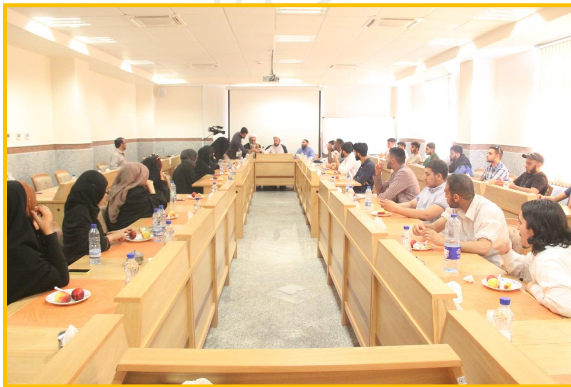
تشکیل جلسه پس از بازدید از مرکز