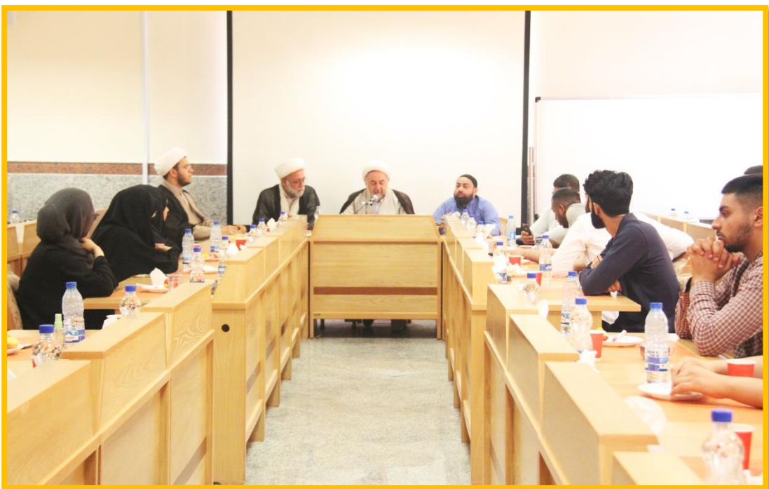
ارائه بحث توسط حجت الاسلام و المسلمین حصارى