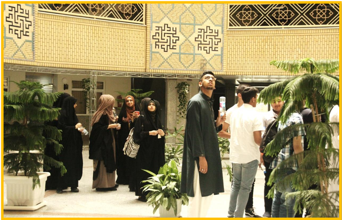
بازدید از فضای مرکز