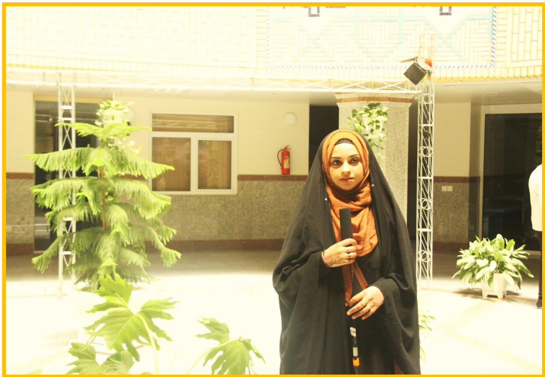
مصاحبه با میهمانان